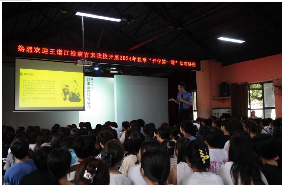
案例五：学生参加培训现场照片

1、2024年下半年我校邀请了双清区法院法官进行了防诈骗知识讲座，我校组织专业人员进行了消防知识讲座；日常管理中，学校重视对在校生的德育教育，开展法制教育、礼仪、心理健康等课程，对在校学生进行思想教育；